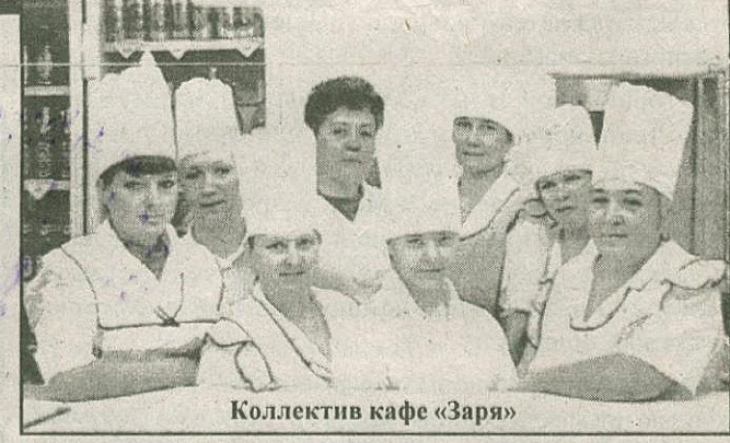
Коллектив кафе «Заря»