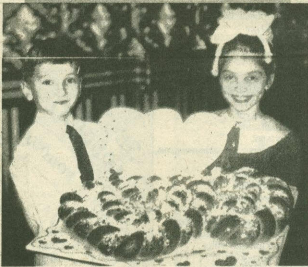
Мы будем рядом с тобой всегда, Ты друг мой, и в этом уверена я!