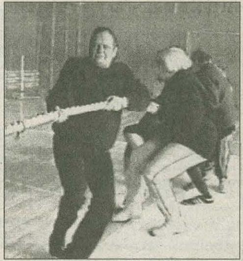
Благодарим за участие в первой спартакиаде города! Призываем и другие организации бюджетной сферы проявить активность, заниматься физкультурой и спортом!