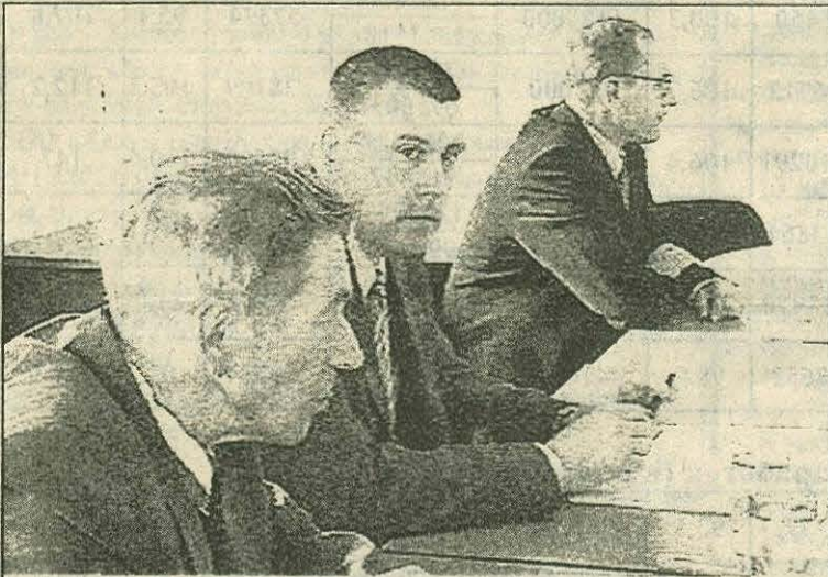
«Семь раз отмерь, один - отрежь» - главный принцип принятия важного решения.