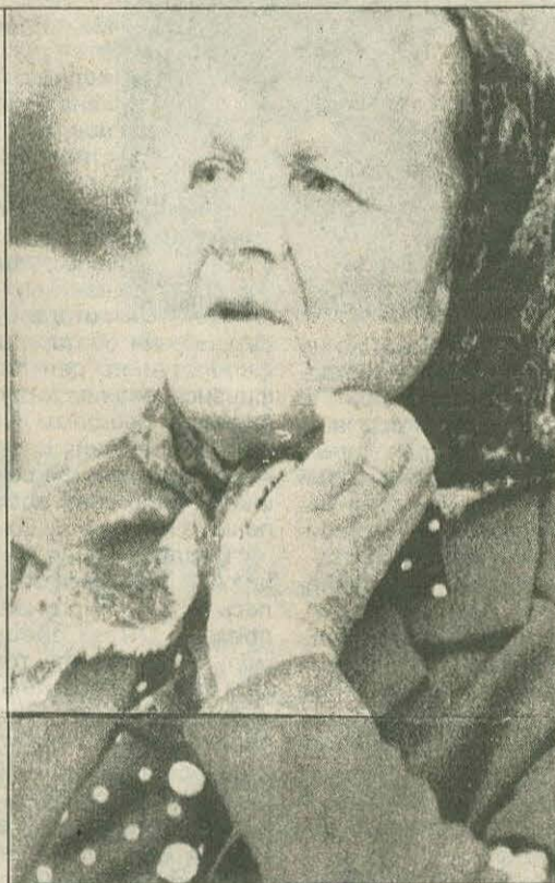
Мадонны двадцатого века - наши матери.

О силе вашей любви слагаются легенды. Вы никогда не перестаете заботиться о тех, кому дали жизнь, вырастили и проводили от родного порога в большую жизнь. Велика и бескорыстна материнская любовь. И во все времена звучит над Землей Молитва матери о мире и счастье для своих детей.