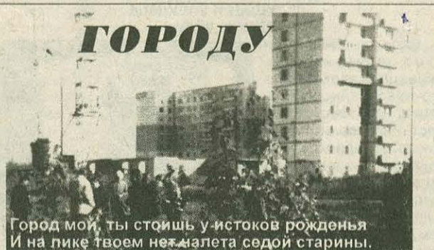
Город мой, ты стоишь у истоков рожденья И на лике твоём нет следа седой старины.

Ты, как юноша стойкий, поешь о своем назначенье, Что с пятнадцатилетия у тебя все еще впереди.