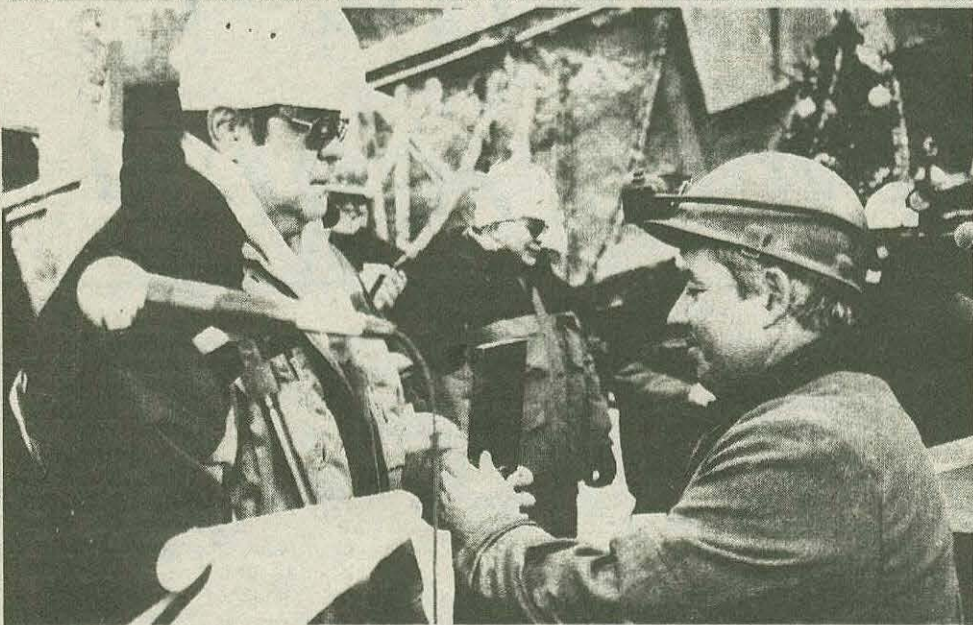
На снимке: губернатор области А.Г. Тулеев вручает свидетельство о добыче в Кузнецком бассей-