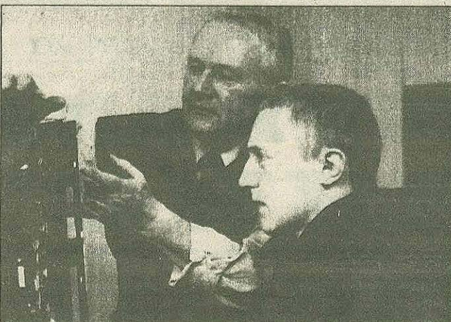
Не прерывается связь поколений: дед и внук.