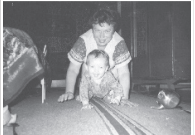
Л.Ф. Короленко «Тараканы бега».