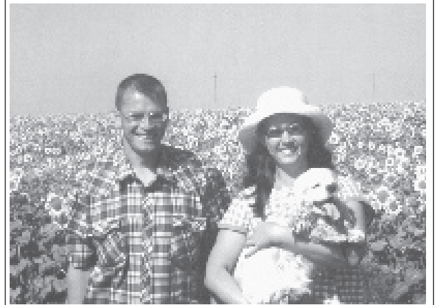
«Поле, русское поле».