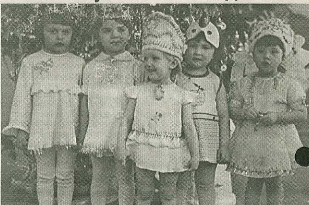
Ансамбль «Пятерочка».

Присылайте самые разные фото из вашего семейного альбома по адресу: г.Полысаево, ул.Космонавтов, 88, МУ «Полысаевский Пресс-центр», редакция газеты «Полысаево». Ждём от вас качественные, контрастные снимки интересные подписи к ним. Самые лучшие фото ждёт приз! Участвуйте и побеждайте!