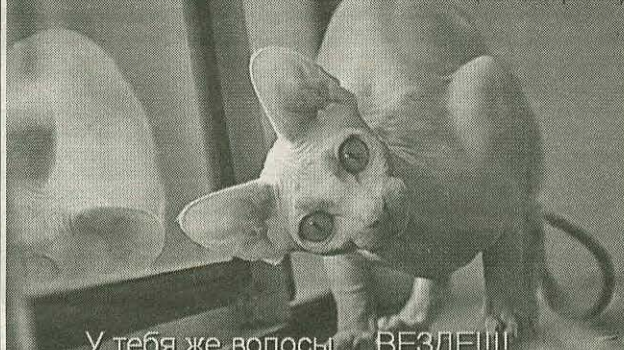
У тебя же волосы... ВЕЗДЕ!!!!

Ой мамочки, хозяин, какой ты страшный!!!