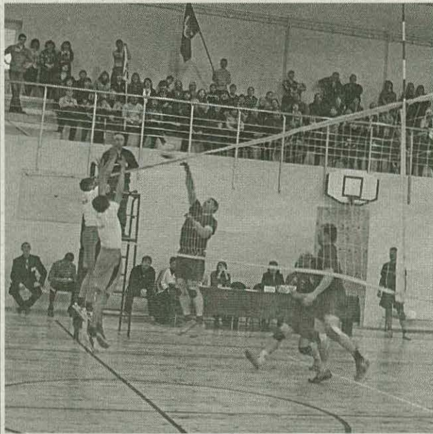
С образованием Детско-юношеской спортивной школы на базе стадиона им. А.Н. Абрамова и городского молодёжного центра, в ведении которого находится бассейн, у горожан появилась возможность получать широкий спектр услуг хорошего качества.

В уставах этих муниципальных учреждений записано, что наряду с основными видами деятельности они могут заниматься организацией досуга и общественно-полезной работой среди детей, подростков и молодёжи, т.е. могут быть центрами по месту жительства. Полысаевский городской Совет народных депутатов принял нормативные акты, регулирующие работу учреждений в этом направлении. Так, для большего охвата населения досуговыми и спортивно-массовыми мероприятиями в ДЮСШ предоставляются платные услуги для жителей города в свободное от основного учебно-тренировочного процесса время. Это прокат автомобилей класса «багги», фигурных и хоккейных коньков, пластиковых лыж, ракеток для большого тенниса, бадминтона, скейтборда, снегохода (возможна помощь инструктора). Можно позаниматься в тренажёрном зале под наблюдением инструктора, поиграть в настольный теннис. На стадионе регулярно проходят матчи чемпионата Кузбасса по футболу среди команд 2-го дивизиона, областные и городские соревнования по разным видам спорта, спартакиады среди работников ЖКХ, энергетиков, угольщиков, что позволяет жителям города стать активными участниками общественной жизни, приобрести