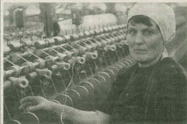
Бывшая прядильщица бывшего КСК.