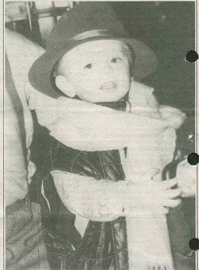
АРТИСТ МИША - НА ГАСТРОЛЯХ (Фото из семейного архива Г.И. Шаровой).

Приглашаем вас принять участие в фотоконкурсе «Ты да я, да мы с тобой!»