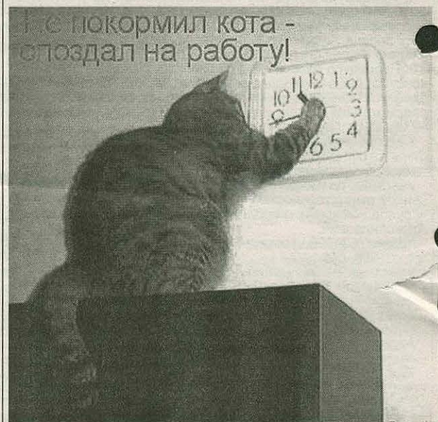
Не накормил кота - опоздал на работу!

Ответы на сканворд, опубликованный в №29 от 30.07.2010г.