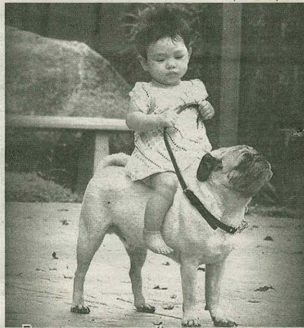
- Выручать дитё пришлось! Пони в рост ей не нашлось!!!