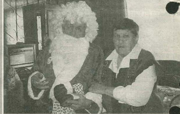
Дед Мороз, Дед Мороз, Куда ветер тебя унес?