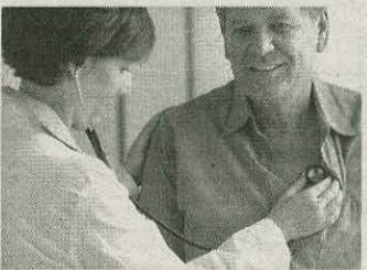
(Страница подготовлена по материалам Интернет).

Запомните, что только врач может правильно установить причину боли в области сердца, поставить диагноз и назначить лечение. Успех лечения более чем на половину зависит от вас самих: будете ли вы пассивно болеть или же активно помогать врачу в борьбе с болезнью.