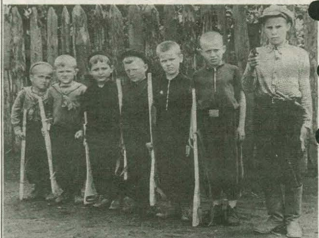
К защите Родины готова команда юности моей – Великолепная семёрка горда готовностью своей. А. АБУШАЕВ.