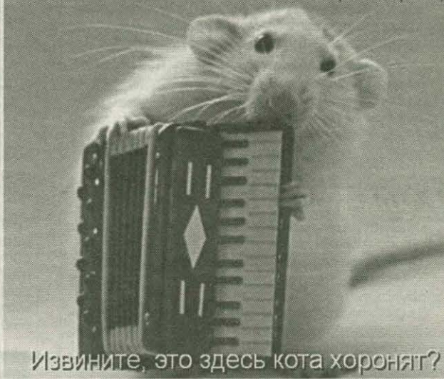
Извините, это здесь кота хоронят?