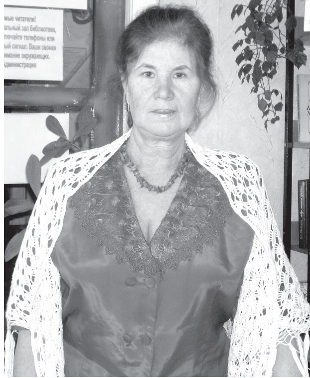
Мне читали ильный зал библиотеки, почитайте телефоны или ый сигнал. Ваши книги мне окружили. дминистрация

Посещает «Клуб выходного дня», выращивает комнатные растения и дарит их знакомым.