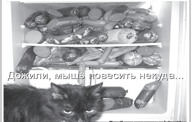
Дожили, мышь повесить некуда...