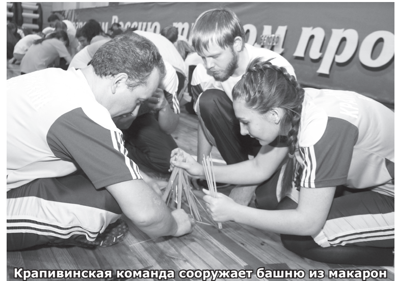
Крапивинская команда сооружает башню из макарон