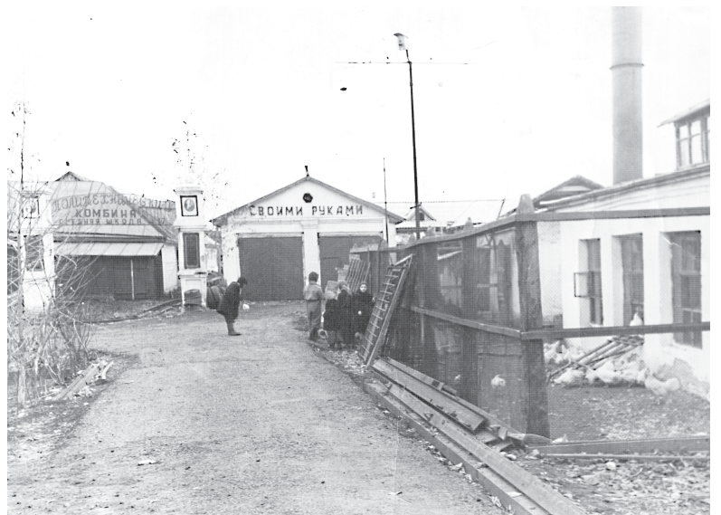
Политехнический комбинат школы №17.

«15 республик - 15 сестёр» - один из ежегодных праздников. Каждый класс представлял республику. А какие спектакли ставили! «Ревизора» Н.В. Гоголя, «Женитьбу Бальзамина» А.Н. Островского. Костюмы сами шили. А потом ездили по деревням и показывали эти спектакли.