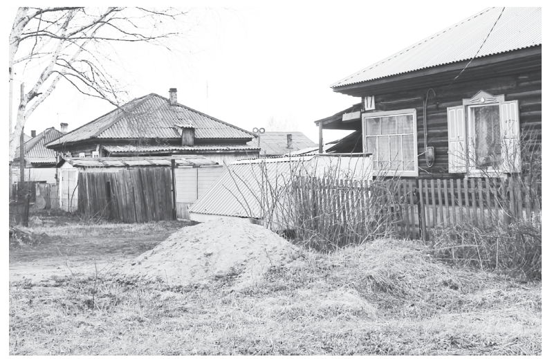
На снимке: кто-то считает подобное хранение песка нормой.