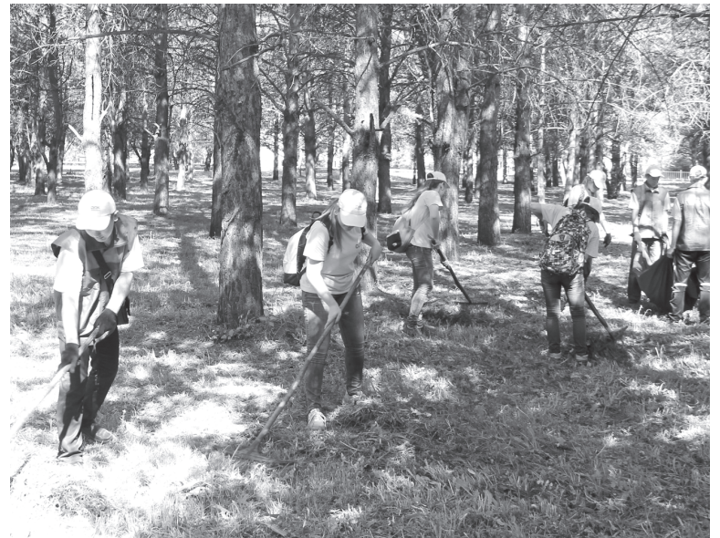
Трудовые отряды на благоустройстве города.

Если говорить о добровольчестве, то на протяжении нескольких лет здесь действуют три добровольческих отряда. Число волонтеров постоянно растёт, на сегодняшний день их количество достигло трёх сотен человек. Ребята из отряда «Забота» оказывают адресную помощь нуждающимся жителям города: складывают уголь, пропалывают огороды и т.п. Подружки из «Импулса» занимаются благоустройством социальных объектов города. Творческий отряд «ЛУЧ» оказывает помощь при организации и проведении городских мероприятий и различных добровольческих акций. Каждый год в нашем городе успешно проводятся такие акции, как «Георгиевская ленточка», «Свеча