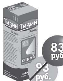
ТИЗИН Коило, спрей назальный 0,1% 10 мл