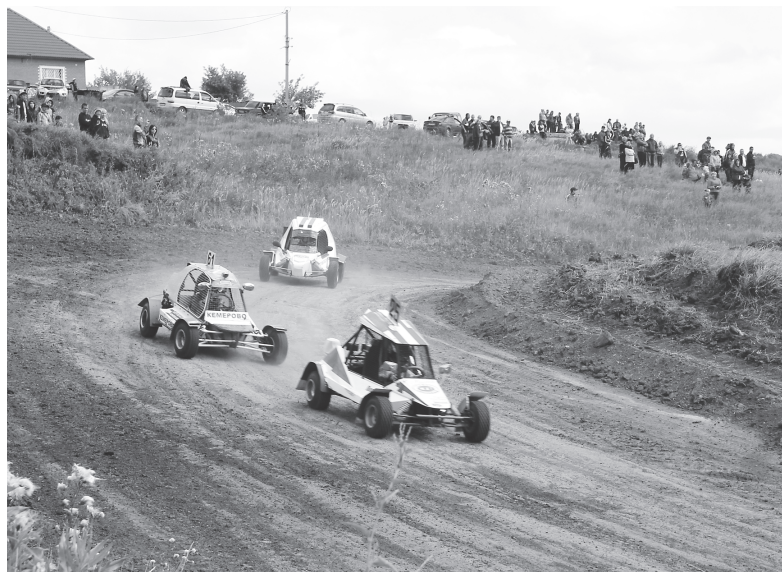
Борьба за победу в классе ДЗ-мини