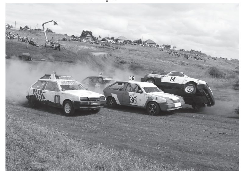
Страсти в классе Д2Н