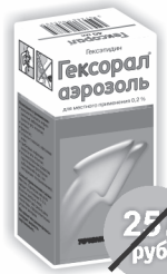
ГЕКСОРАЛ, аэрозоль 0,2% 40мл