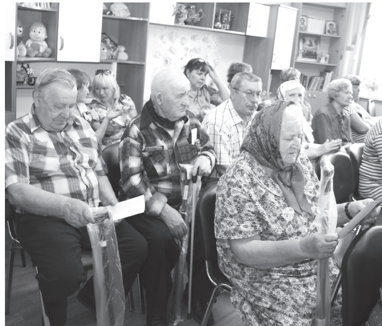
Вручение средств реабилитации - одна из традиционных акций поддержки пожилых людей.

Ежегодная, очень затратная, но крайне важная для многих семей акция «Помоги собраться в школу» проходит накануне нового учебного года. Как правило, внимание органов соцзащиты обращено на многодетные,