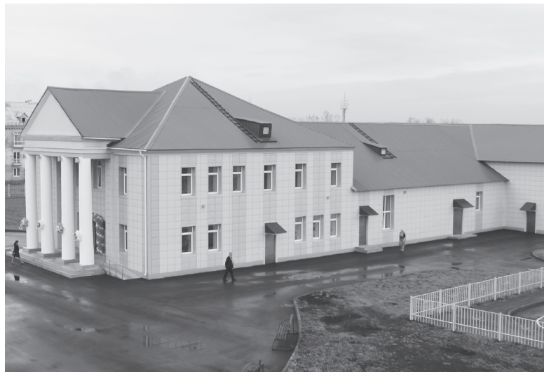
Культура и досуг

Работа предстоит большая, но при активном участии горожан у нас обязательно все получится!