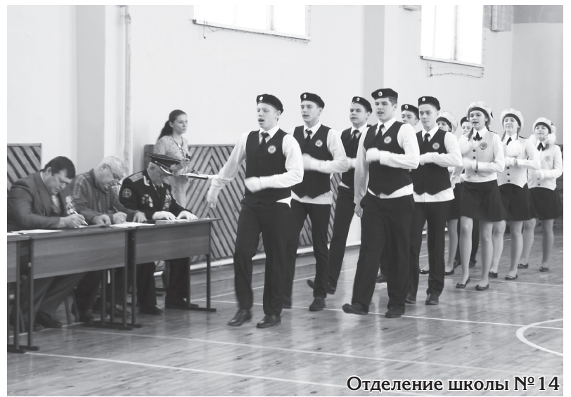
Отделение школы №14

Эх, немного не дотягивали нынешние участники! Одни руки боялись выпрямить, другие