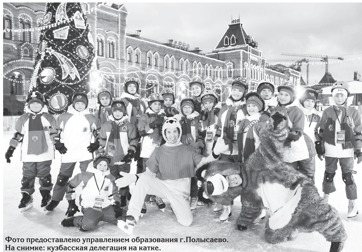
На снимке: кузбасская делегация на катке.