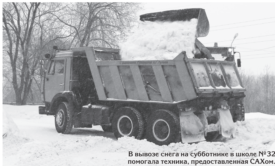
В вывозе снега на субботнике в школе №32 помогла техника, предоставленная САХом.

Наталья СТАРОВОЙТОВА.