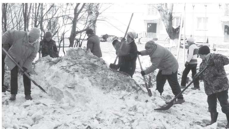
Работники управляющих компаний ежегодно рыхлят снег весной.

вроде не видно, значит, ничего предосудительного не сделал. Накапливаясь слой за слоем, весной при оседании снега вытаскивают чуть ли не мусорные полигоны. Под многими балконами оттаяли целые острова окурков – здесь живут безответственные курильщики. Пешеходные зоны парка и скверов «усеяны» и большим количеством экскриментов домашних любимцев – собак. «Со снегом растает, после дождика растворится», – считают хозяева, ленясь брать на прогулку мешок для уборки за своим псом. В противовес обычно указывают на валяющийся мусор.