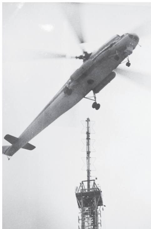
Установка передающей антенны на телевизионную башню в городе Кемерово

Наталья МАСКАЕВА.