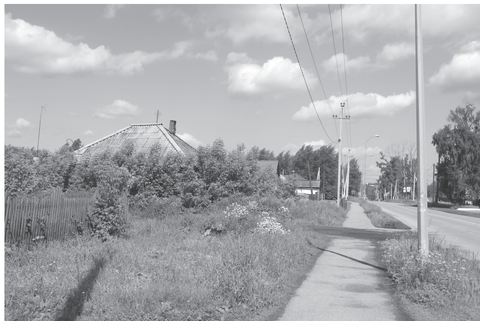
Вот такой неприглядный вид у дома на одной из центральных улиц города.