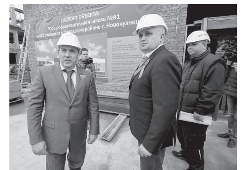
НА ФОТО: Глава региона контролирует ход строительства школы №81 в Новокузнецке

нять задачи быстро, качественно, без авралов, но в чётко установленные сроки – должны уйти. Их действиям будет дана оценка в соответствии с законом. Перед контрольно-счётной палатой и контрольным управлением открылся широкий фронт работы.