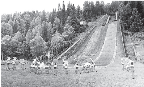
■ На этом трамплине можно тренироваться не только зимой, но и летом

венное покрытие, отремонтирована гора разгона 67 м, выровнен грунт горы приземления, на неё уложены эластичные маты и пластиковая сетка. На эти цели из областного