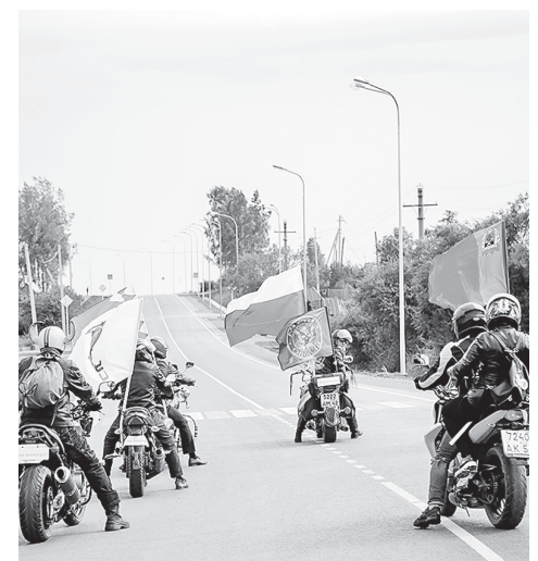
■ Новую дорогу первыми испытали местные байкеры

Кстати, компания «Кузбассразрезуголь» не только строит и ремонтирует дороги, но и переустраивает водоводы, строит очистные сооружения в Бачатском, можно сказать, даёт поселку новую жизнь.