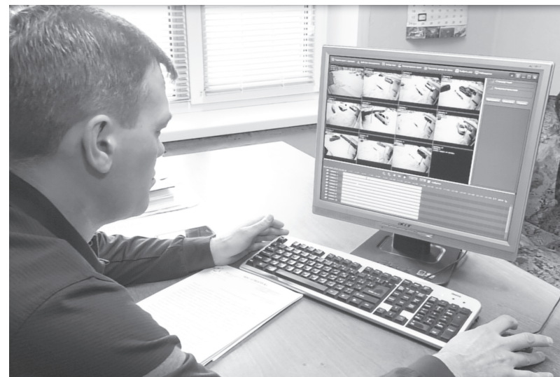
Каждый из жильцов дома, где установлено видеонаблюдение, получает доступ к записям с камер.