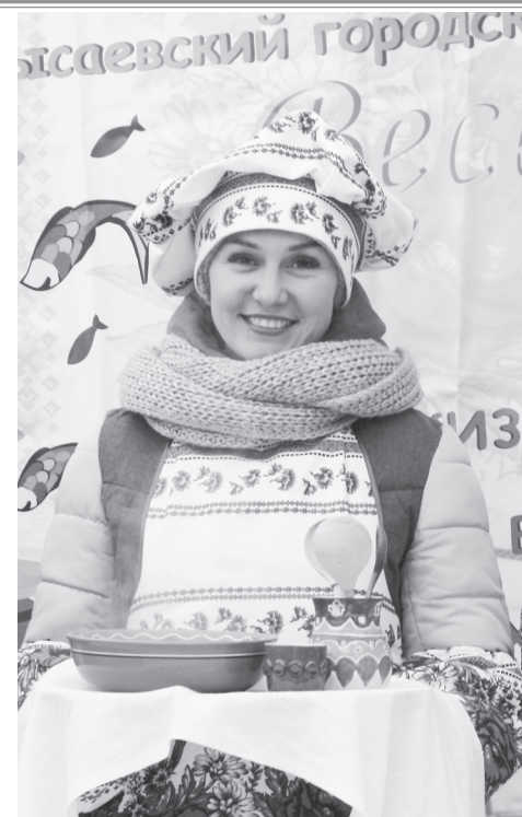
Наша уха – самая вкусная!

Итог фестиваля «Сибирская еда» подвело конкурсное жюри. Оно оценивало