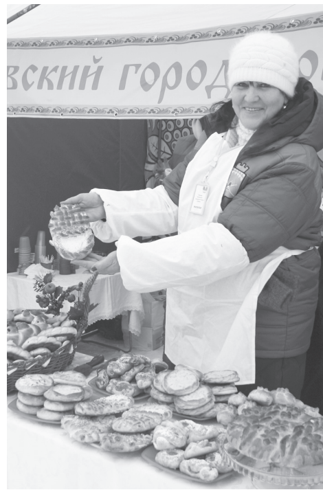
Сдоба у беловчан – на любой вкус!

распродаже. Какой только её здесь не было – судак, окунь, щука, сом! Но самой большой (более метра в длину) оказался