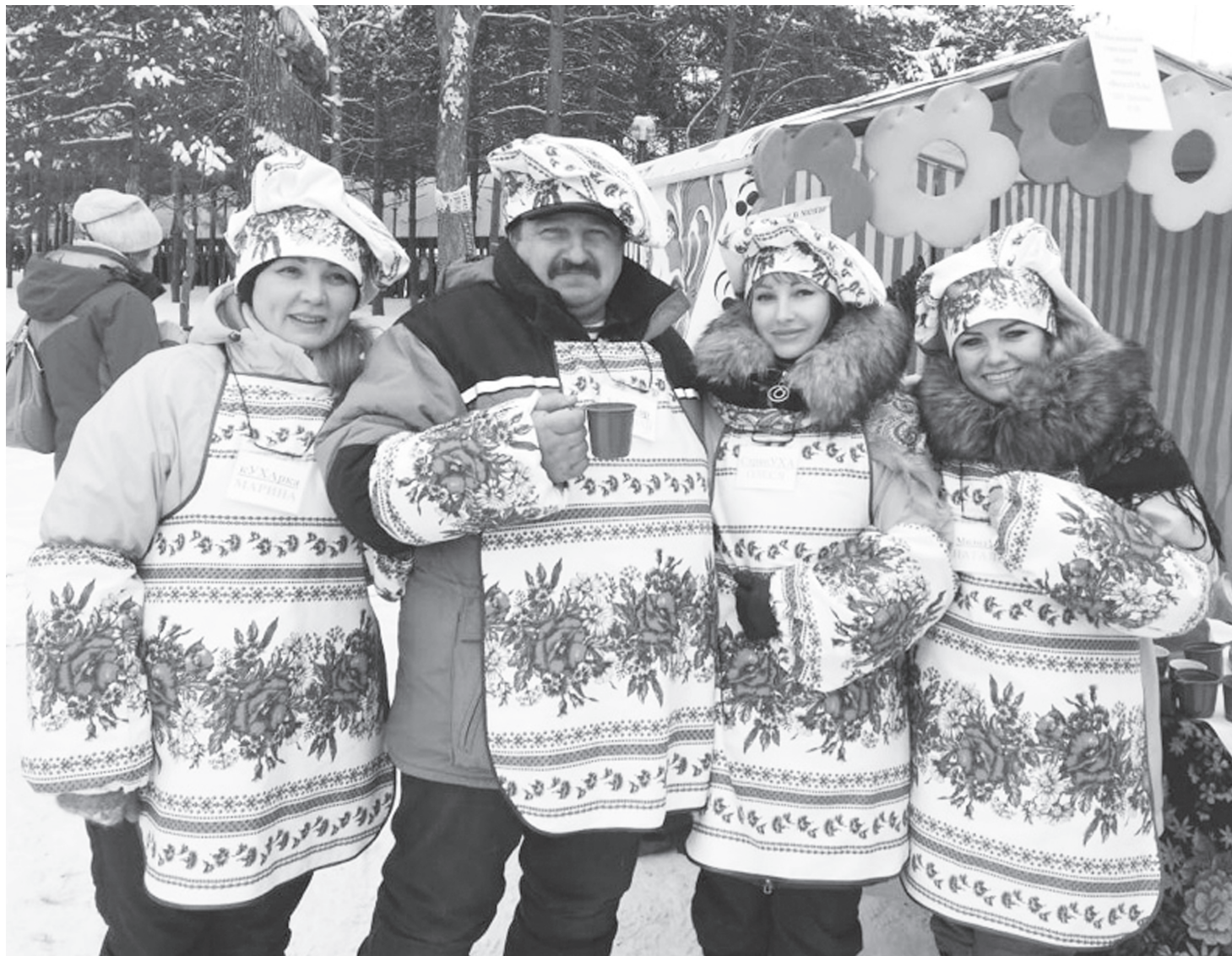
Участники команды «ВеселУХА» на фестивале «Сибирская еда».