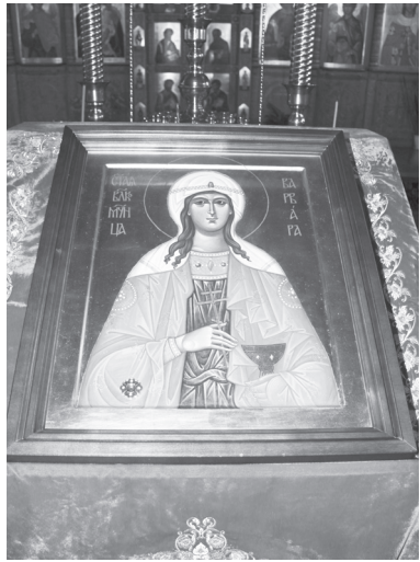
Икона святой великомученицы Варвары.

Икона святой великомученицы Варвары с её мощами теперь украшает храм Серафима Саровского в г.Полысаево. Это произошло благодаря инициативе и поддержке руководства угольной компании «Полысаевская».