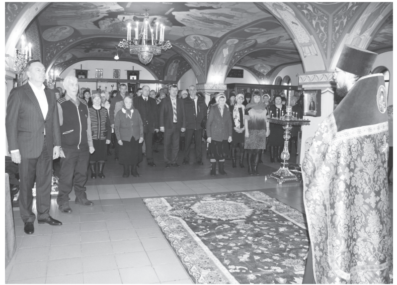
Молебен в храме прп. Серафима Саровского.

В 2007-м на угольных предприятиях Кемеровской области погибло 198 горняков. А в 2008 году, с того момента, как в Кузбассе стали почитать святую