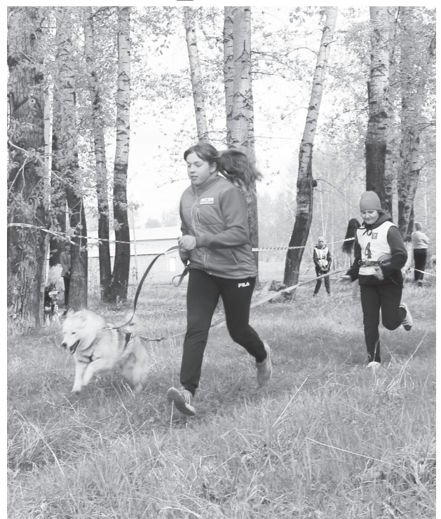
для ребят, для них этот день прошёл настоящим незабываемым.

Общение, социальная интеграция и открытие нового для себя – вот, что стало главным на этом спортивном празднике