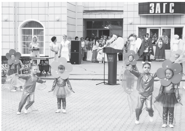
Один из моментов праздничного торжества.