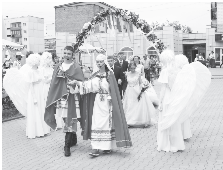
Главные персонажи праздника - Пётр и Феврония.

День семьи, любви и верности отмечают в России с 2008 года, и с каждым годом он только набирает популярность. Дату 8 июля выбрали по той причине, что этот день является днем памяти святых Петра и Февронии, покровителей семьи и брака. Идея праздника возникла у жителей города Муром Владимирской области, где покоятся мощи святых супругов. В жизни Петра и Февронии воплотились черты идеального супружества – благочестие, милосердие, взаимная любовь и верность.