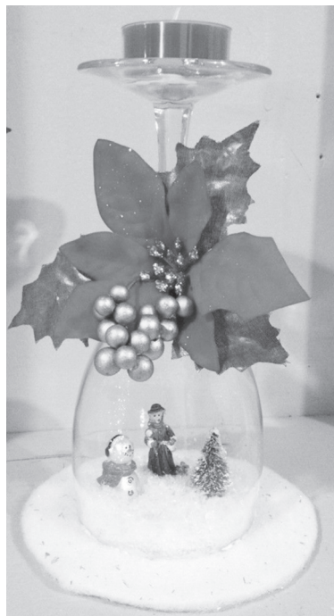
«Ёлка в бокале»

«Как в Новый год без ёлки? Надо же детишек порадовать живой ёлочкой», - скажете вы. А мы предлагаем сделать новогоднюю композицию из нескольких хвойных веток. Во-первых, за ёлку вы отдадите гораздо больше денег, чем за лапник. Во-вторых, ваш дом будет украшен оригинально и необычно, вызовет удивление и восхищение гостей. В-третьих, вы можете открыть в себе и в своих детях неожиданный талант дизайнера, устроить конкурс на лучший новогодний букет, а наши советы, надеемся, помогут вам этом.