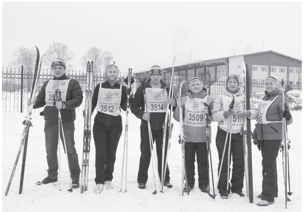
Команда Полысаевского пресс-центра.

Работники администрации и муниципальных служащих первыми пробежали свой километр. Уже на старте стало ясно, что все рванули к победе, ну, или, как минимум, к призовому месту. Кто-то мастерски размашистыми движениями конькового хода быстро скрылся между деревьев, другие классическим передвижением по трассе пытались не отстать. В общем, этот забег длился недолго. Первым к финишному створу среди мужчин