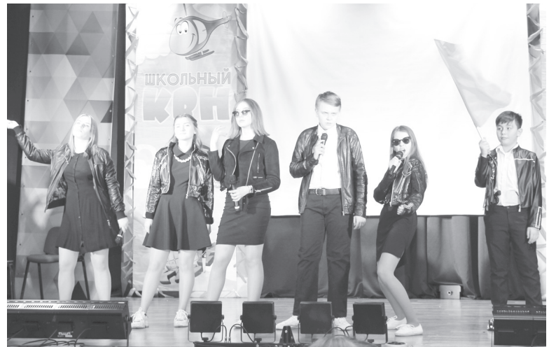
На снимке: момент выступления команды «Внуки, я ваш дед!».

На конкурсе видеороликов «Звёздный сюжет» были представлены истории о проведении кастинга в команду «Красногорский экстрим», фильм ужасов от «Внуков» и чудесная музыкальная композиция с запоминающимся «Люли-люли» от «Централи».