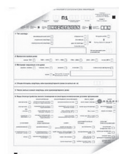
Переписной лист ВПН-2020

Сколько людей и домохозяйств проживают на этой жилплощади и используют разные виды благоустройства? Сообщит перепись населения.