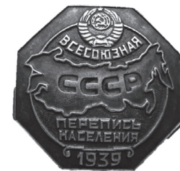
Знак переписи населения

Был принят специальный негласный указ СНК СССР о розыске и учете