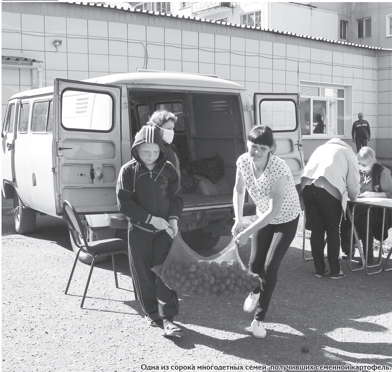
Одна из сорока многодетных семей, получивших семенной картофель.