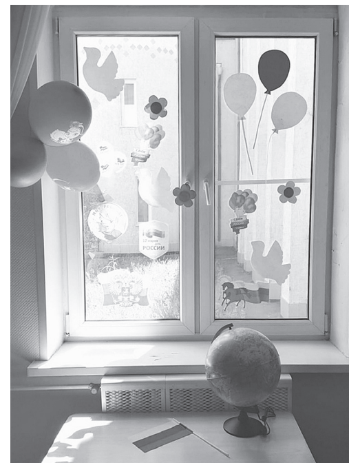
увидели ваше творчество, фотографии нужно выложить в социальных сетях с хештегами акции: #ОкнаРоссии, #ЯлюблюРоссию, #МояРоссия и рассказом о своем городе, дворе, малой родине.

Акция продлится до 12 июня, и у любого человека ещё есть время, чтобы принять в ней участие. Украсьте окно своей квартиры или дома с помощью красок, наклеек, трафаретов, чтобы это было видно с улицы. Можно нарисовать контуры сердца и, не закрашивая рисунок, сфотографировать наиболее удачный ракурс вида из окна через сердце. Чтобы как можно больше людей