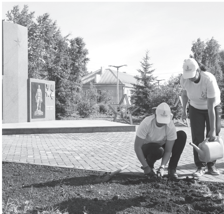
твенную поддержку. Пусть яркие краски цветов радуют нас всех, а не только тех, кто выкопал рассаду

Давайте бережно относиться хотя бы к тому немногому, что в период коронавируса сделано силами горожан, волонтеров и «Благоустройства», без помощи молодёжных трудовых отрядов, которые всегда оказывали сущес-