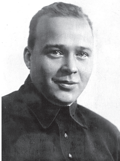
ГОЛИКОВ АРКАДИЙ ПЕТРОВИЧ (22.01.1904 - 26.10.1941)

Аркадий Гайдар (литературный псевдоним Голикова Аркадия Петровича) - единственный из писателей, создавший произведение, которое не просто было прочитано детьми, оно породило общественное движение среди подростков. Все