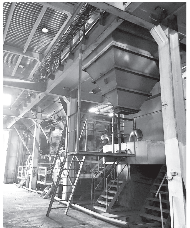
На снимке: котлы малой котельной.