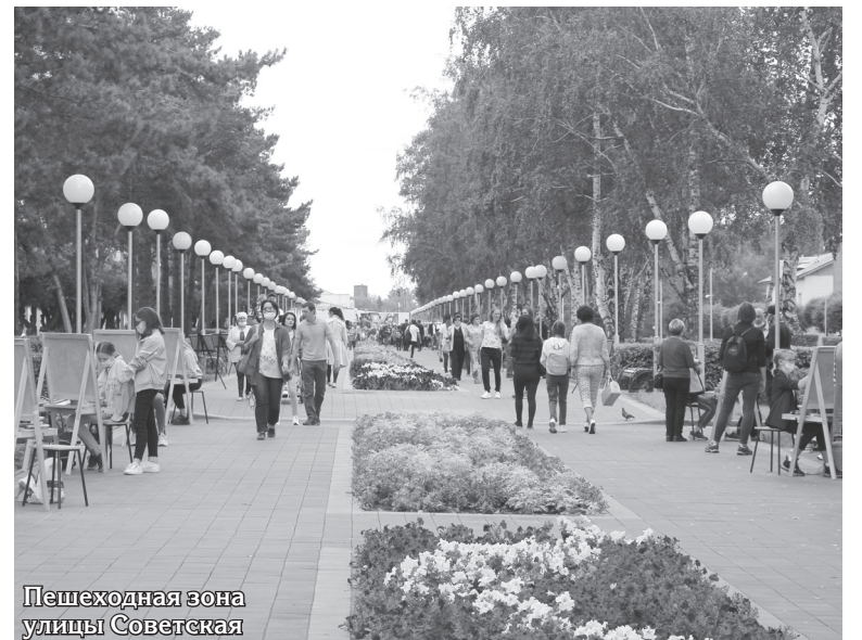
Пешеходная зона улицы Советская