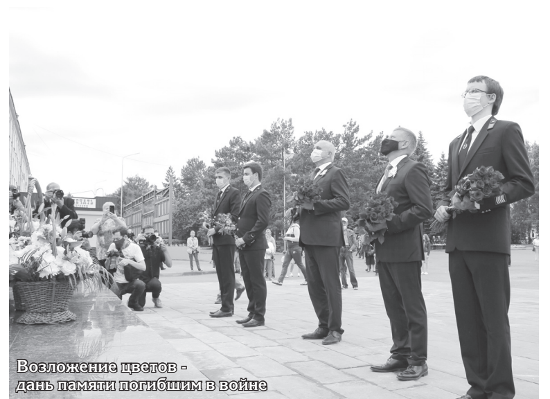
Возложение цветов - дань памяти погибшим в войне