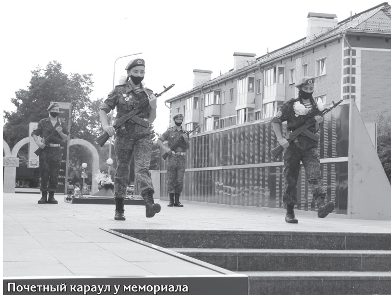
Почетный караул у мемориала

Один из внушительных обновлённых объектов – физкультурно-оздоровительный комплекс «Металлург». Раньше на его месте было старенькое здание, а окружающая территория наполовину заросла сорняками. Теперь здесь высится четырёхэтажный корпус, включающий два больших игровых зала, бассейн на шесть дорожек, множество залов для