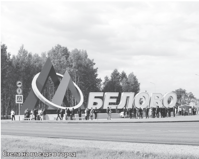
Стела на въезде в город

Всекузбасский праздник День шахтёра в этом году прошёл не так широко, как в прежние годы. Эпидемиологическая ситуация требует от нас особенно бережного отношения к окружающим, поэтому массовых праздничных мероприятий не было. Впрочем, для шахтёров этот день прошёл в кругу семей, где они, как всегда, принимали самые тёплые поздравления!