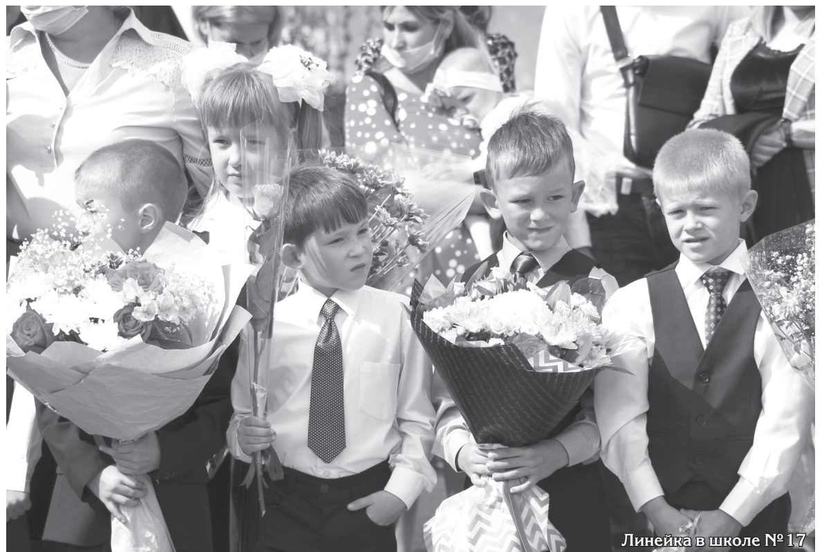
Линейка в школе № 17