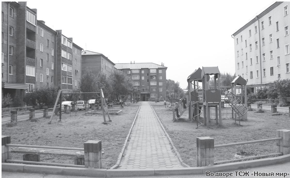
Во дворе ТСЖ «Новый мир»