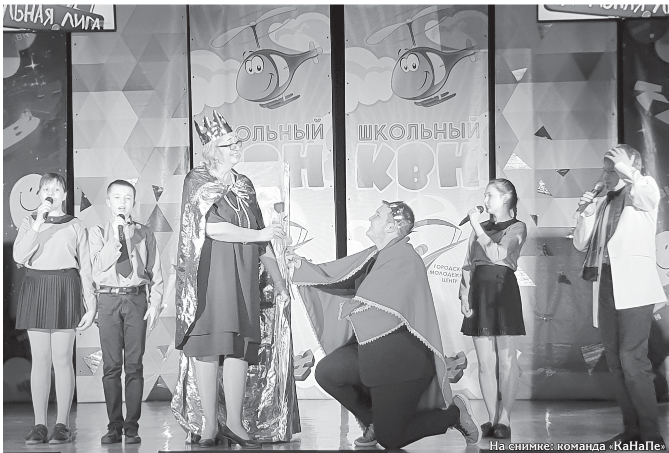
На снимке: команда «КаНаПе»