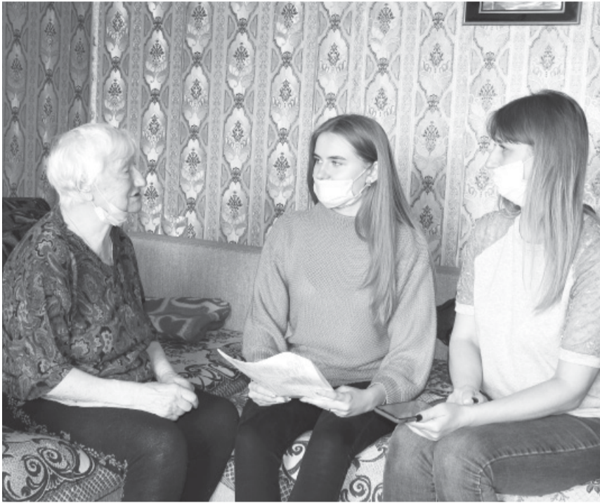
Женщина охотно делилась воспоминаниями с ребятами, показывала фотографии в альбоме. А волонтеры задавали много вопросов рассказчице, которая до мельчайших подробностей помнит всю свою жизнь...