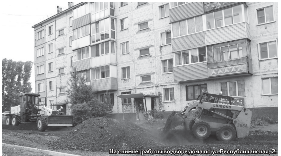
На снимке: работы во дворе дома по ул. Республиканская, 2.