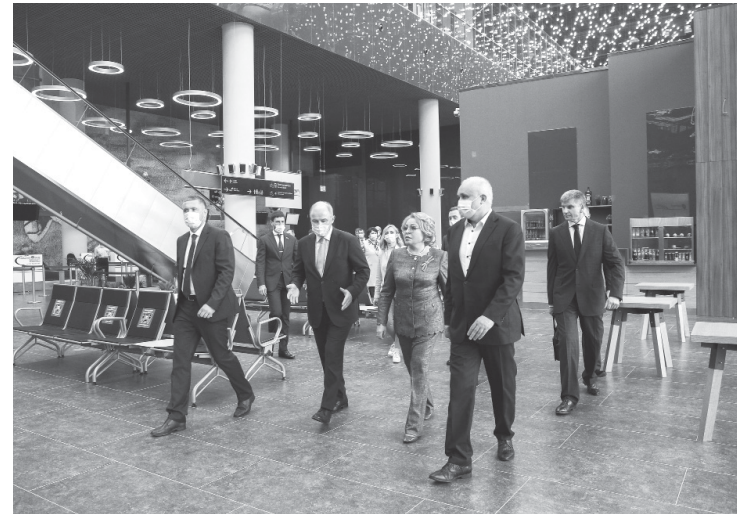
Посещение нового терминала аэропорта им. А. Леонова вместе с главой Совета Федерации РФ В. Матвиенко.

мая Губернатор Сергей Цивилев открыл новый терминал аэропорта Кемерово имени Алексея Архиповича Леонова. Терминал построен в рекордные 12 месяцев и введен в эксплуатацию в мае 2021 года. Первый утренний рейс из Кузбасса авиакомпании «Аэрофлот» отправился из нового терминала в 8.10. До отлета пассажиров и экипаж поприветствовал глава региона Сергей Цивилев. Стоимость проекта составила 3 млрд рублей. Здание состоит из трёх надземных этажей и одного подземного; количество телетрапов — два. Новый современный терминал позволит увеличить пропускную способность аэропорта на 130%, с 200 до 460 пассажиров в час, и повысит качество обслуживания пассажиров.